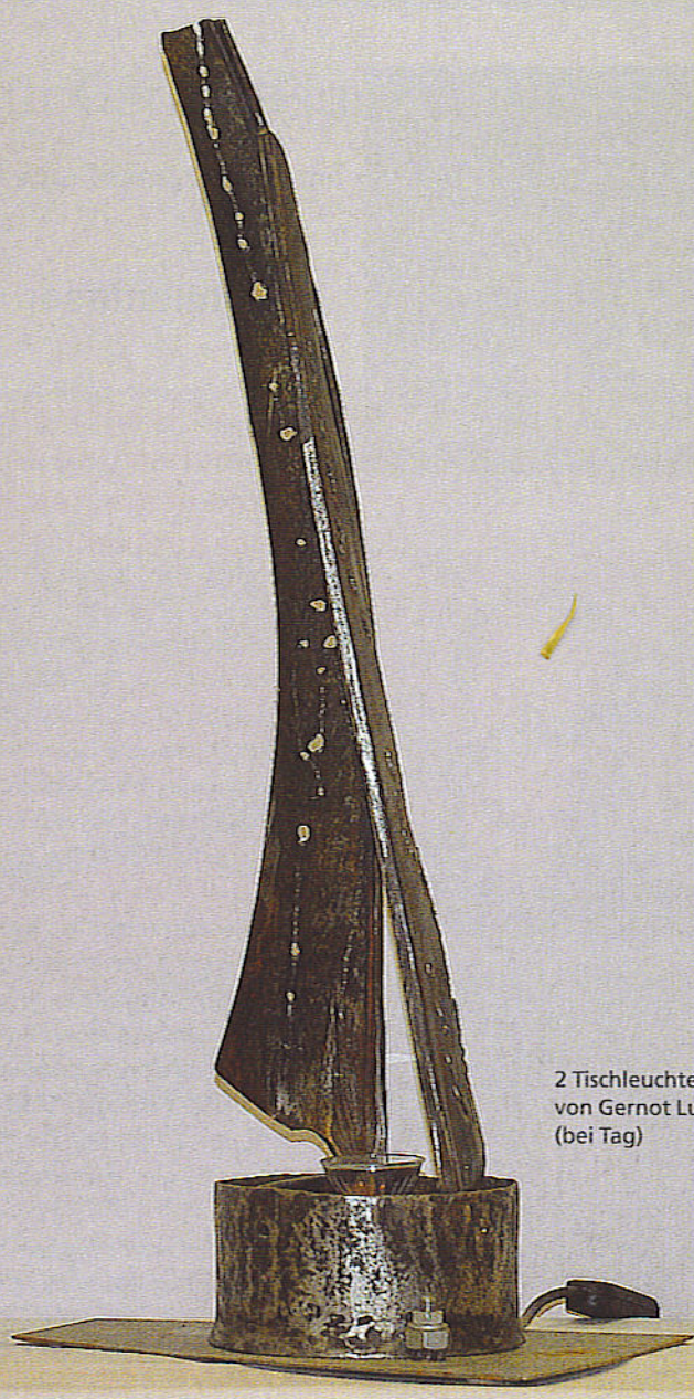
2 Tischleuchte »strebend« von Gernot Lukasek (bei Tag)